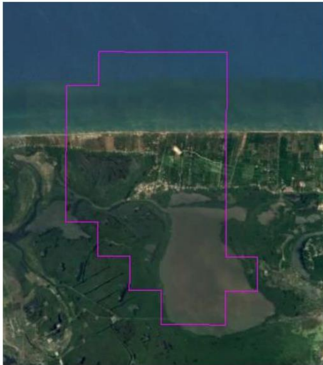
Ilustración 1. Mapa que identifica la ubicación del Área Contractual.

El Área Contractual 23, denominada Tajón, tiene una superficie de 27.52 km 2 y se encuentra ubicada en el municipio de Paraíso, que forma parte de la subregión de Chontalapa, la cual está integrada por los municipios de Cárdenas, Comalcalco, Cunduacán, Huimanguillo y Paraíso, en el estado de Tabasco.